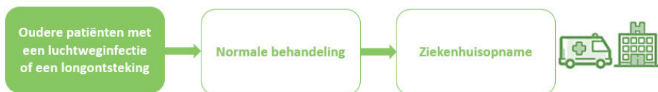
Figuur 1: Huidige situatie.

U heeft een luchtweginfectie of longontsteking en bent 65 jaar of ouder. Uw huisarts schrijft dan in veel gevallen een combinatie van antibiotica/ virusremmers, extra zuurstof en/of puffers voor. Voor deze behandeling worden veel patiënten opgenomen in het ziekenhuis. Maar dat is lang niet altijd nodig. Het is heel goed mogelijk u thuis, in uw eigen omgeving te behandelen. Om dat vaker en beter mogelijk te maken hebben de zorgpartners in de regio (huisartsen, ziekenhuizen, verpleeghuizen en thuiszorgorganisaties) afspraken gemaakt hoe ze dat gaan doen. We noemen dat De Haagse Luchtweginfectie Zorgbrug. In deze folder leest hier meer over.